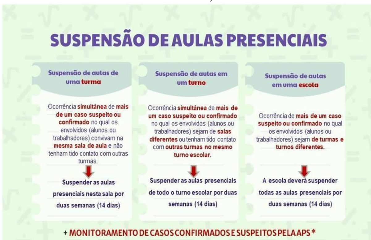
Figura 1 – SITUAÇÕES EM QUE O GESTOR ESCOLAR DEVERÁ SUSPENDER AS AULAS DE UMA TURMA, TURNO OU DE UMA ESCOLA