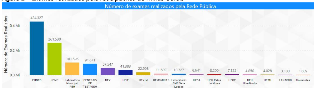
Figura 2 - Exames realizados pela rede pública de Minas Gerais

Dados sujeitos a atualização mensal. Atualizado em 22/03/2022. Os quantitativos realizado pelo Instituto René Rachou estão contabilizados como FUNED. Além da realização do exame RT-PCR (fase analítica), a FUNED realiza a fase pré-analítica (recebimento, triagem e preparo) de até 2.550 amostras encaminhadas para a UFMG semanalmente.