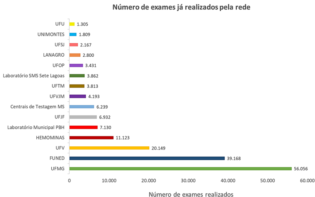
Figura 2. Exames realizados pela rede pública de Minas Gerais

Fonte: Gerenciador de Ambiente Laboratorial – GAL/Funed. Dados sujeitos a atualização. Atualizado em 26/10/2020. Os quantitativos realizado pelo Instituto René Rachou estão contabilizados como FUNED.